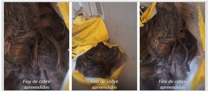
Fios de cobre apreendidos