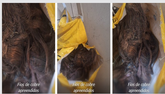
Fios de cobre apreendidos