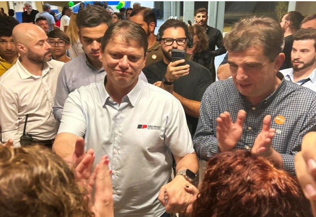
Governador Tarcísio de Freitas ao lado do Prefeito de Porto Ferreira, André Braga, durante visita à municípios da região central de SP

O governador de São Paulo, Tarcísio de Freitas, esteve em Santa Rita do Passa Quatro, em Porto Ferreira e em São Carlos nesta quarta-feira (10), para a entrega de obras do governo estadual e para anunciar um robusto pacote de obras e investimentos que somam R$ 750 milhões destinados a 26 municípios da região central do Estado. A visita oficial de dois dias marcou mais uma etapa da 'Caravana 3D', iniciativa do Governo que percorre diferentes regiões com foco nos três pilares da gestão: Desenvolvimento, Dignidade e Diálogo.