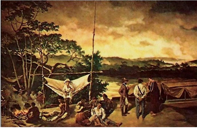
Gravura representando os desbravadores dos sertões paulistas no século XVIII.